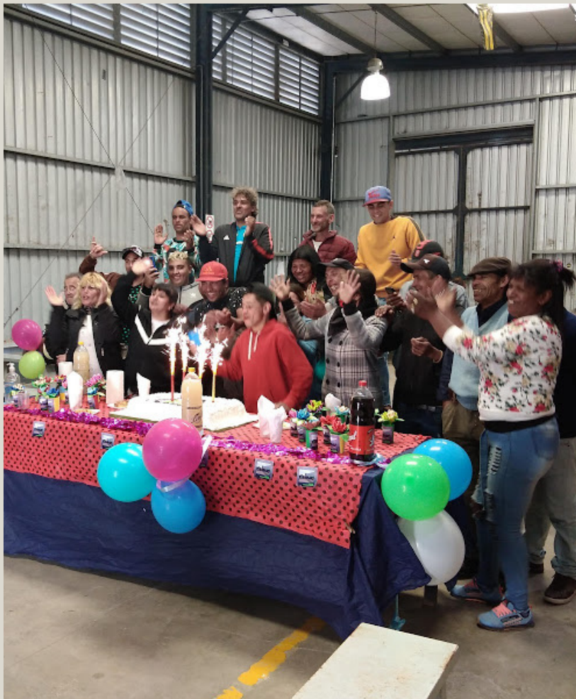
Escribe Jorge Ramada

Tenemos que pensar que en el punto principal y objetivo debe ser el clasificador. El trabajo de clasificar no es indigno lo indigno son las condiciones en las que trabaja. Se necesita una logística para abastecer a las plantas y mejorar el trabajo. El objetivo de la logística tiene que ser el trabajo y los clasificadores, si hay más trabajo, se recicla más y la consecuencia es la mejora del medio ambiente